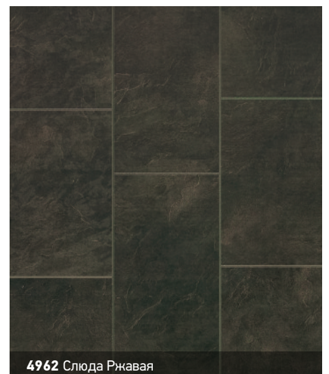
4962 Слюда Ржавая