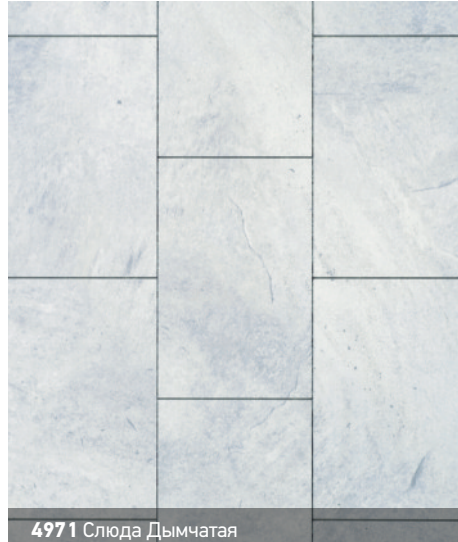
4971 Слюда Дымчатая