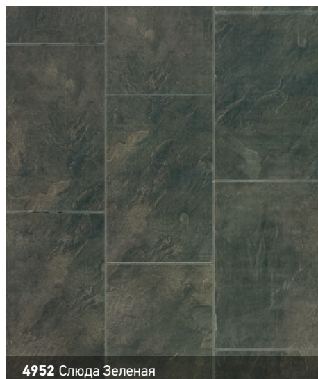
4952 Слюда Зеленая