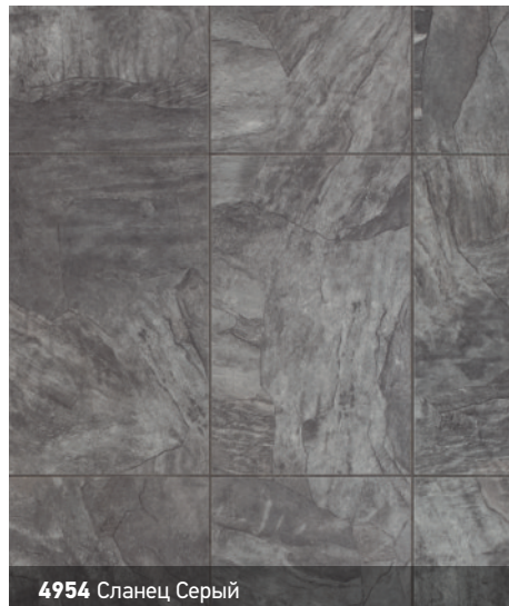
4954 Сланец Серый