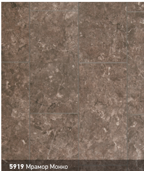
5919 Мрамор Мокко