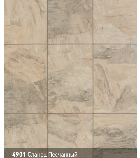
4901 Сланец Песчаный