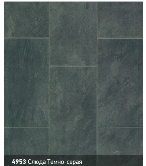
4953 Слюда Темно-серая