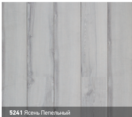
5241 Ясень Пепельный