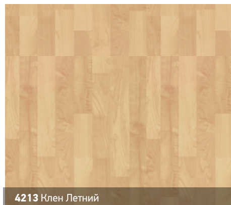
4213 Клен Летний