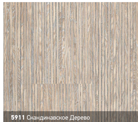
5911 Скандинавское Дерево