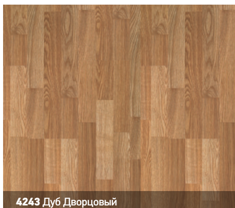
4243 Дуб Дворцовый