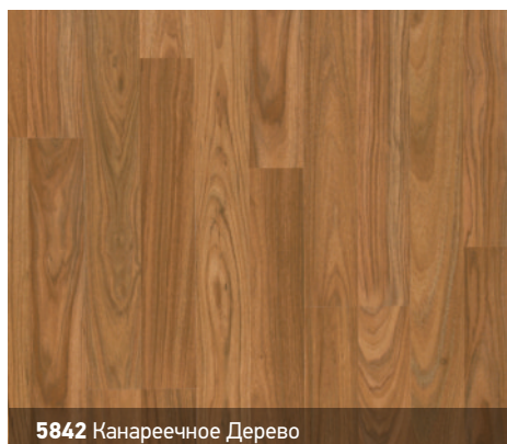
5842 Канареечное Дерево