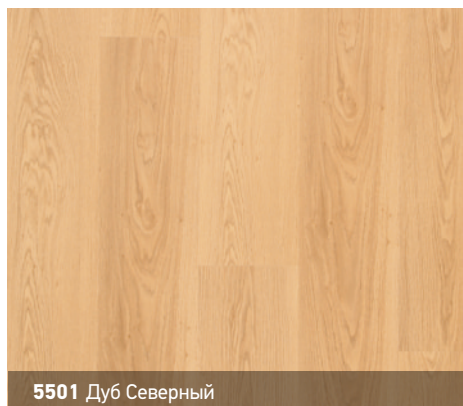
5501 Дуб Северный