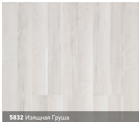
5832 Изящная Груша