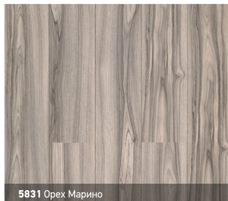
5831 Орех Марино